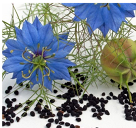
Schwarzkümmelöl Kapseln 90 Stück Fr. 21.50 180 Stück Fr. 39.50 360 Stück Fr. 69.50