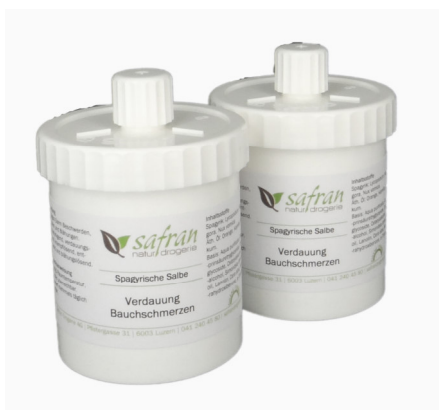
Spagyrische Salbe Verdauung Bauchschmerzen 100g Fr. 29.80