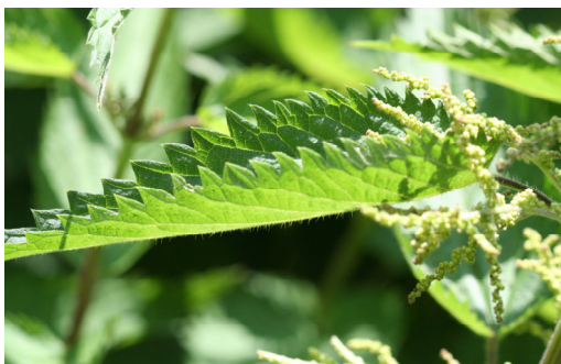
Brennnessel Urtica dioica