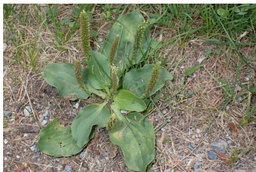
Breitwegerich Plantago major