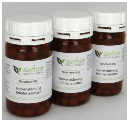
Nervenstärkung 180 Kräutertabletten Fr. 49.00