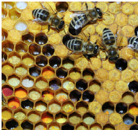
Engadiner Propolis Tinktur 30ml Fr. 42.50