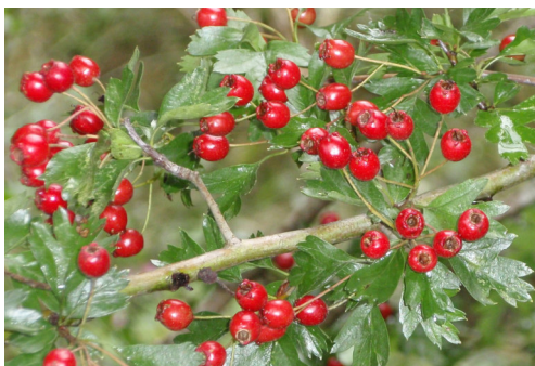
Weissdorn Crataegus oxyacantha