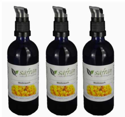
Weihrauch Einreibeöl 100ml Fr. 19.50

Gerne veröffentlichen wir auch Ihren Erfolg mit unseren Produkten.