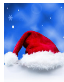
Safran Drogerie Weihnachtsmann